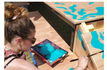
Cancan – QG Ressources et Les tables de la cascade